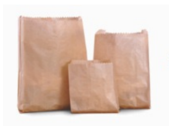
Sacos de papel Kraft